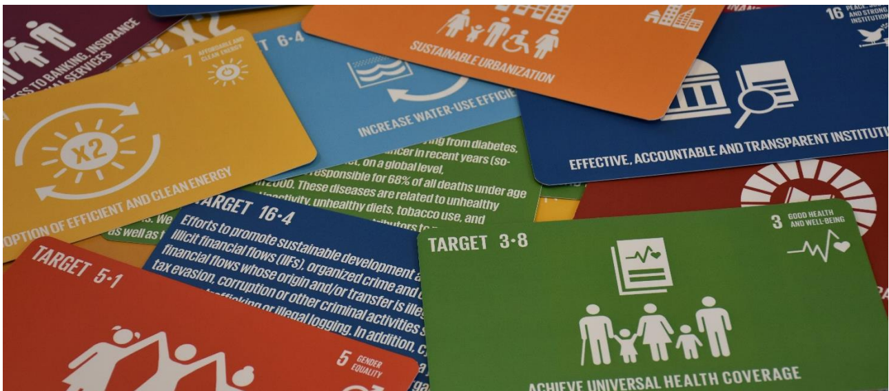
SDG Opportunity Cards