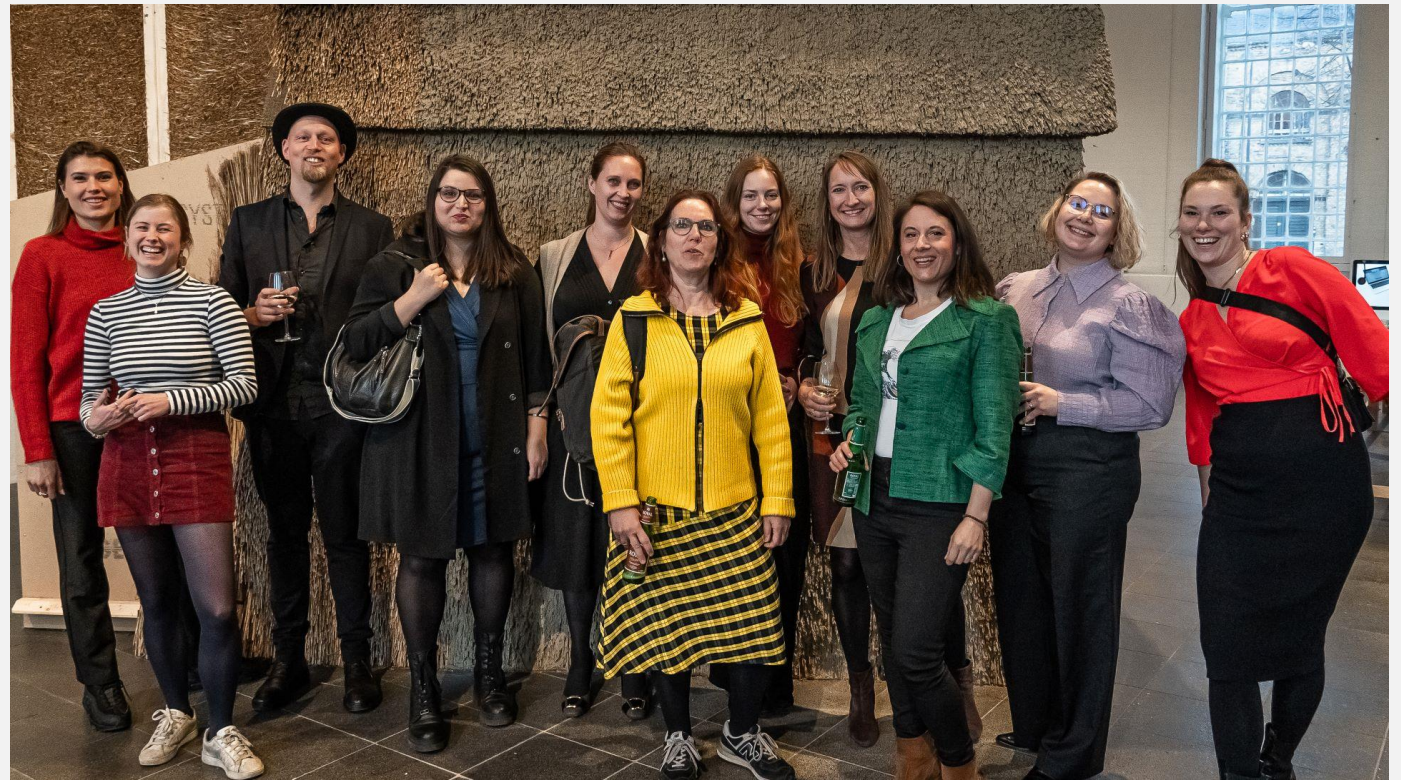
Offentliggjort på kvindernes kampdag 8. Marts 2022