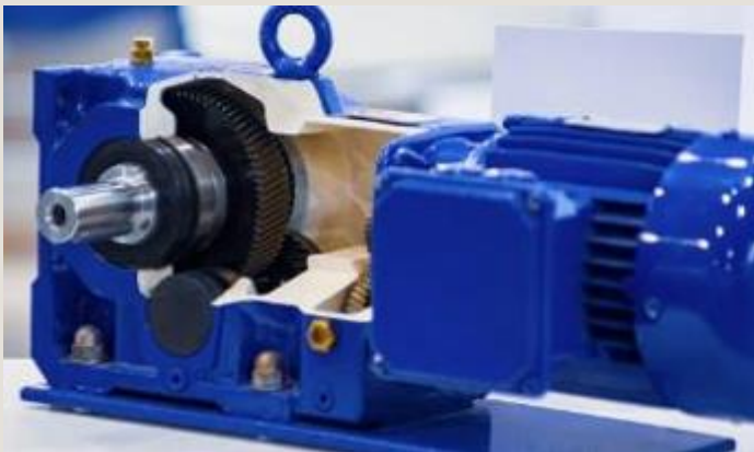
Gear- og maskindele