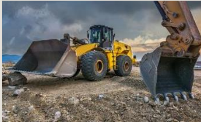
Entreprenørmateriel og trucks