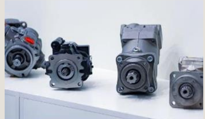
Mobil- og industrihydraulik