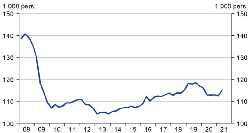
Beskæftigede i metal- og maskinproducenter Fuldtidsbeskæftigede lønmodtagere, sæsonkorigeret

Kilde: Danmarks Statistik og DI, sidste obs. 2. kv. 2021