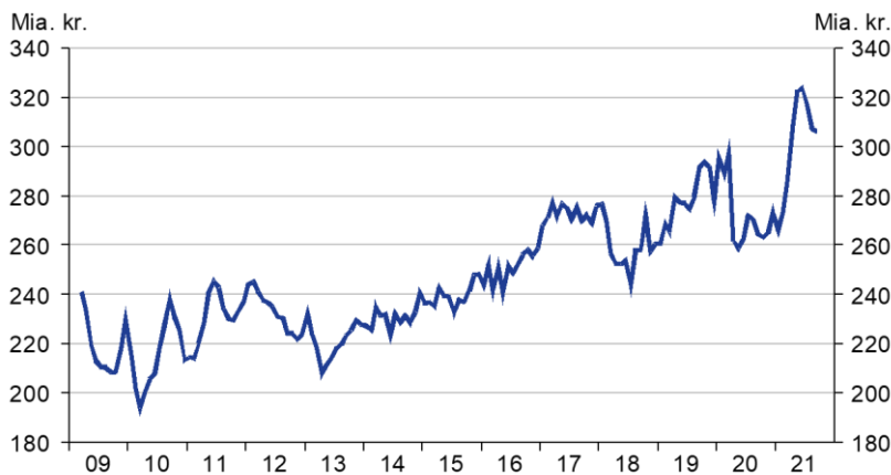
Omsætning i metal- og maskinindustrien mm. 3 mdr. gns. af sæsonkorrigeret årsniveau

Kilde: Danmarks Statistik og DI, sidste obs. sep. 2021