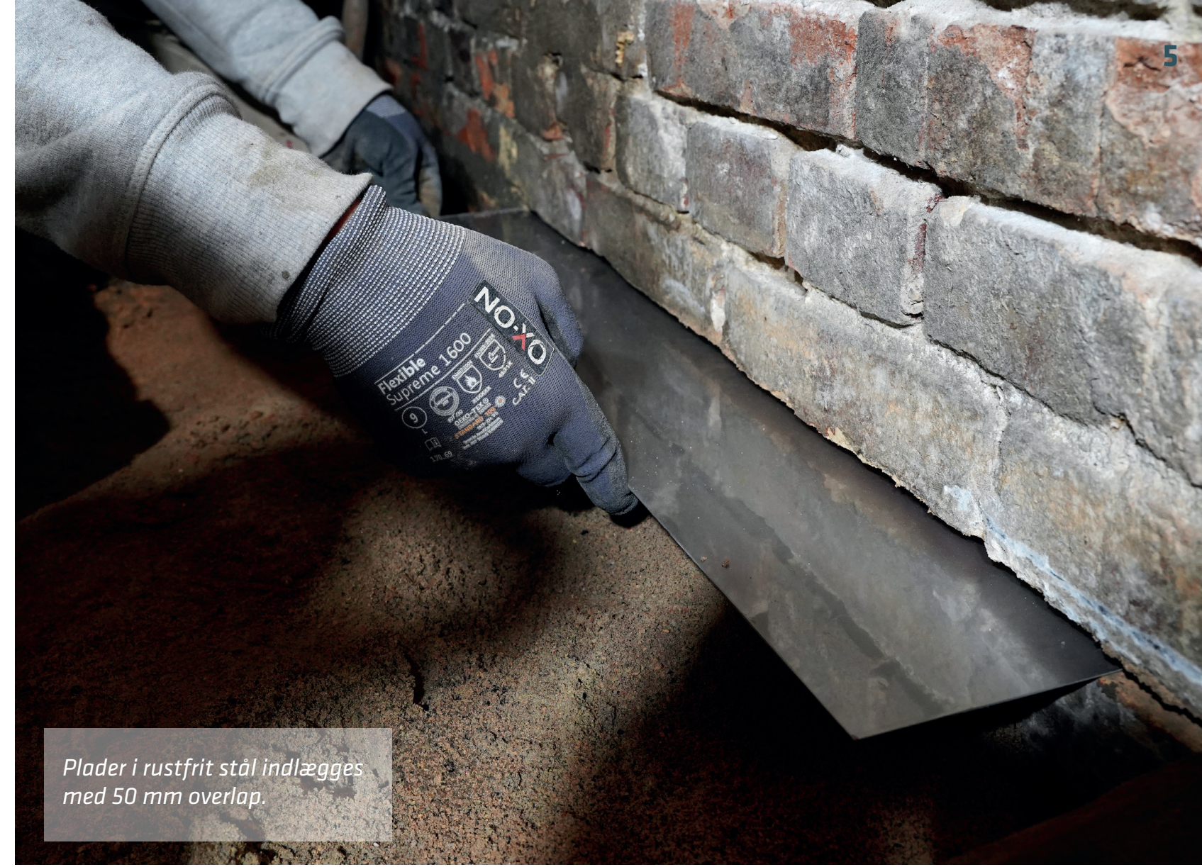
Plader i rustfrit stål indlægges med 50 mm overlap.

Metoden og den samlede løsning varierer fra sag til sag alt efter behov og brugsønsker. Men i forhold til den del som handler om at standse den opstigende fugt i grundmuren – og ikke blot den lodret indtrængende – så går det i al sin enkelhed ud på, at vi fortløbende skærer en 14 mm høj rille vandret i en lejefuge hele vejen igennem murværket. Derefter lægger vi en rustfri stålplade