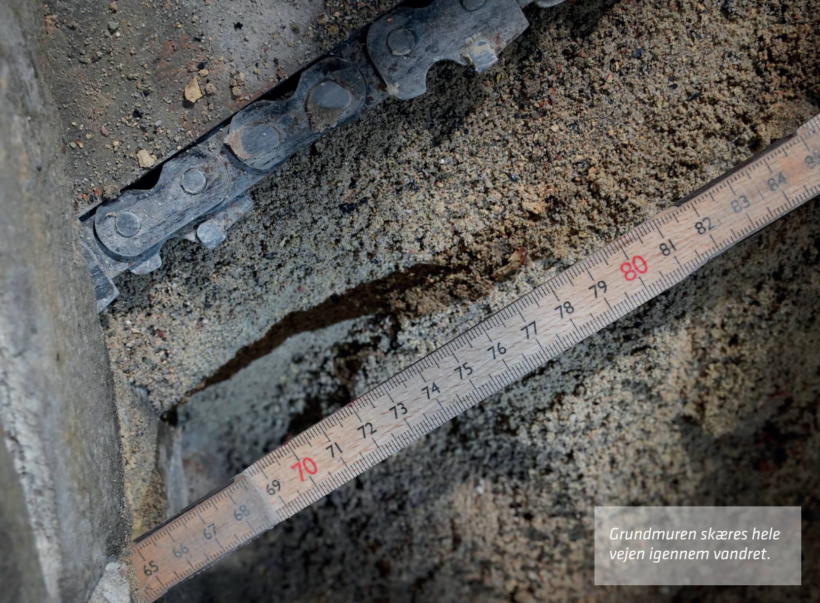
Grundmuren skæres hele vejen igennem vandret.

Når vi taler murværk har vi den såkaldte kapillareffekt, som flytter fugten fra det våde til det tørre, så fugten bare stiger og stiger, indtil den kan komme ud og fordampe. Og det er det, der forårsager, at vi har fugtige og 'sure' kældre med afskalninger, og man mange steder slås med skimmelsvamp i lejligheder helt op til 2. sal. De velkendte metoder fejler ikke noget, men er ofte utilstrækkelige, kan du sige.