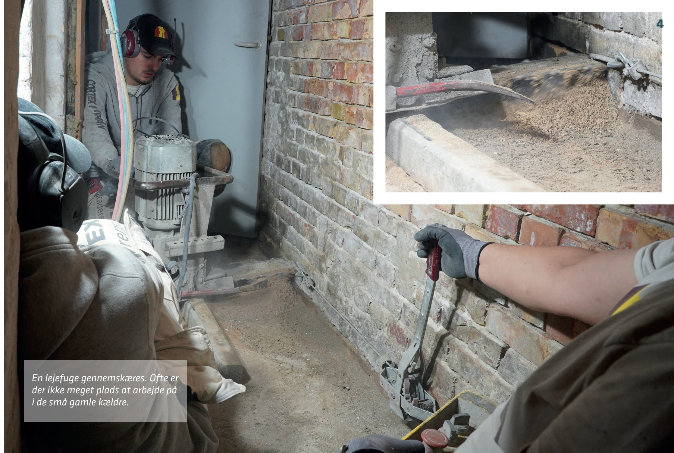
En lejefuge gennemskæres. Ofte er der ikke meget plads at arbejde på i de små gamle kældre.

Det går ud på at indlægge en fugtspærre i grundmurede ejendomme, dvs. ejendomme som er karakteriserede ved at de står på et fundament af mursten. Det er typisk ejendomme fra før 1910, hvor man begyndte at lave fundamenter støbt i beton.