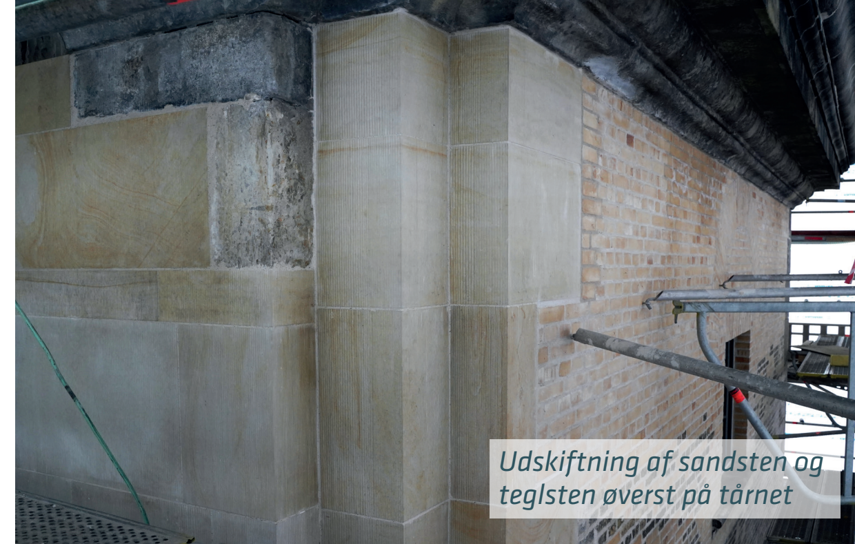
Udskiftning af sandsten og teglsten øverst på tårnet

Venstre lille: Christians Kirke i København