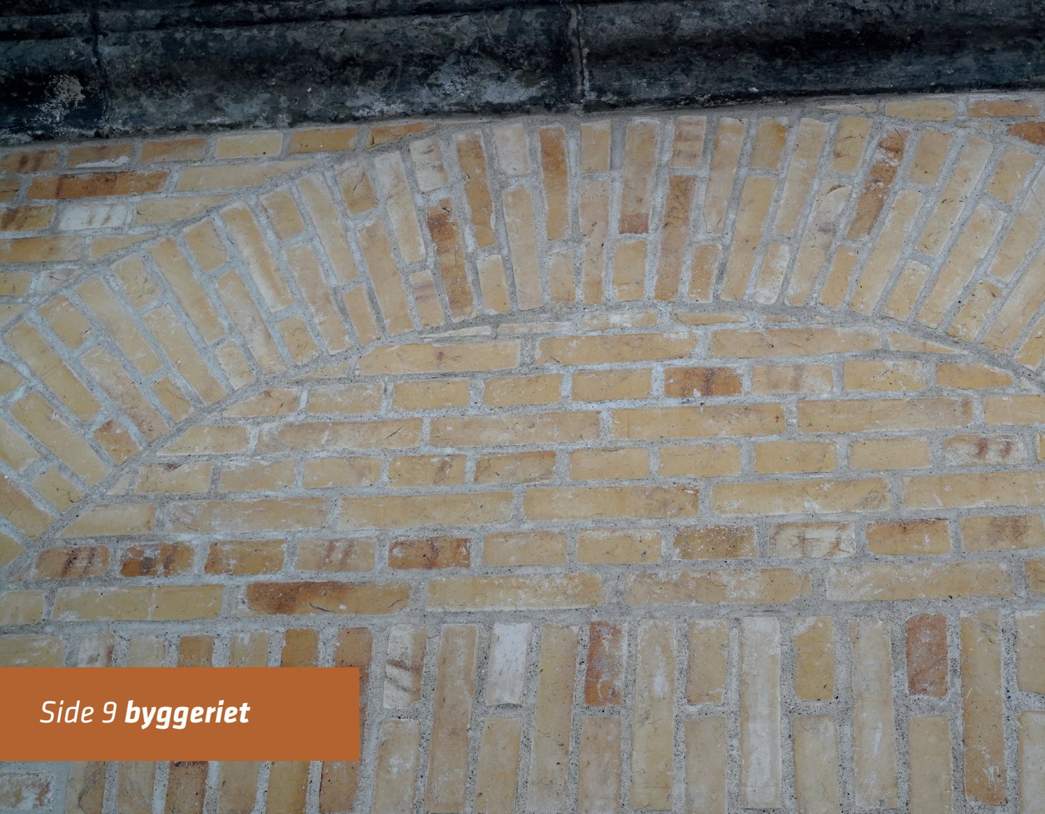
Side 9 byggeriet