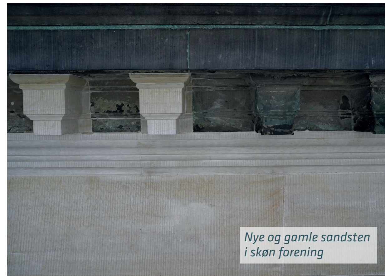
Nye og gamle sandsten i skøn forening