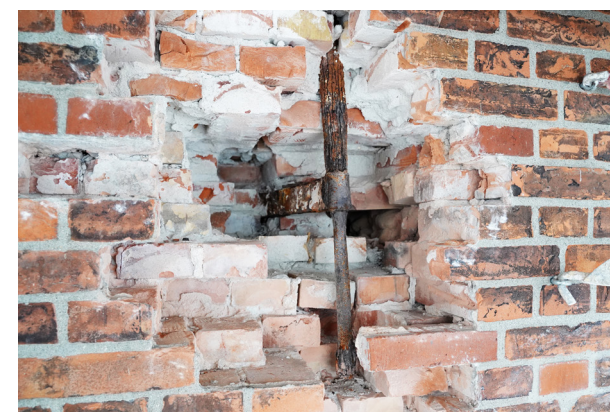
Jernankre og områderne omkring har behov for nænsom restaurering.