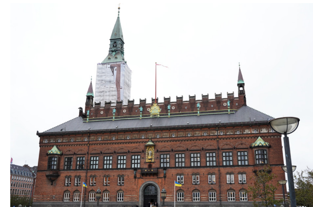
Københavns Rådhus med det indpakkede rådhusårn i baggrunden.