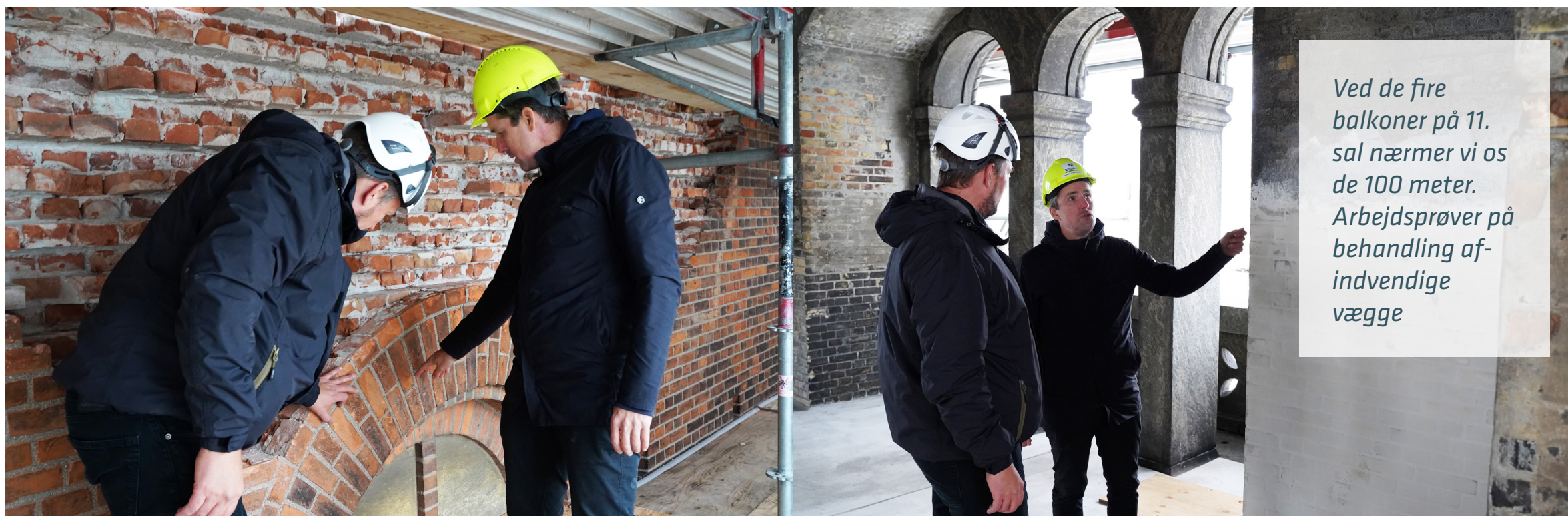
Ved de fire balkoner på 11. sal nærmer vi os de 100 meter. Arbejdsprøver på behandling af indvendige vægge